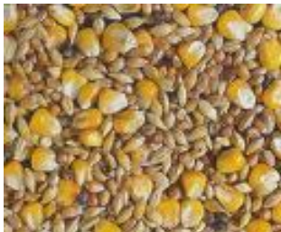
afbeelding 2: gemengd graan.

Voor opgroeiende kippen zijn er verschillende soorten opfokmeel. Deze zijn bestemd voor jonge kuikens en de voeders volgen elkaar op totdat de kippen toe zijn aan gewone korrel.