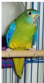
afbeelding 1: Turquoise parkiet

In de winter hebben vogels meer voeding nodig, omdat het dan wat kouder is. Het is ook belangrijk dat je in de winter zorgt voor wat extra licht in de volièr. Dit omdat het eerder donker wordt en vogels dus gemiddeld minder tijd hebben om het voedsel tot zich te nemen. Het aanlaten van een lampje en dit op vaste tijdstippen uit te schakelen is vaak al voldoende.